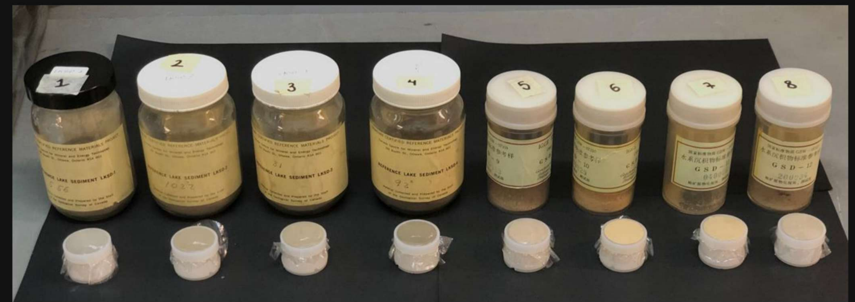
Figura 3. Materiales de Referencia Certificados empleados.