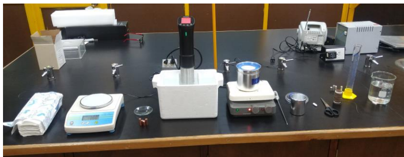
Figura 1. Fotografía que muestra el material y equipo empleados en esta práctica.